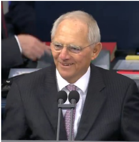
Bundestagspräsident Wolfgang Schäuble hat die Parteien nach dem Aus der Jamaika-Sondierungen zu Kompromissen aufgefordert. "Mit der Wahl hat das Volk entschieden, damit müssen wir als Gewählte nun umgehen, verantwortlich umgehen", so Schäuble zu Beginn der ersten Plenarsitzung nach der Konstituierung.

Der Abbruch der Sondierungsgespräche zwischen CDU, CSU, FDP und Grünen stellt die parlamentarische Demokratie vor eine große Herausforderung. Die Bemühungen, trotz eines für alle Beteiligten schwierigen Wahlergebnisses ein stabiles Regierungsbündnis für die nächsten vier Jahre zu bilden, waren nicht von Erfolg gekrönt. „Wir glauben, dass wir auf einem Pfad waren, auf dem wir etwas hätten erreichen können“, erklärte Angela Merkel in der Landesvertretung von Baden-Württemberg. Dort waren die Sondierungen von CDU, CSU, FDP und Grünen in der Nacht auf Montag ohne weiteres Ergebnis zu Ende gegangen. CDU und CSU werden auch in schwierigen Zeiten Verantwortung übernehmen, versicherte die geschäftsführende Bundeskanzlerin.